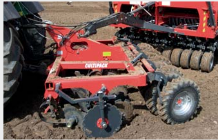
Hydrauliset ajolinjamerkitsimet Heinänsiemenen kylvölaite Jälkiäes